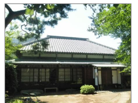
木造平屋寄棟造り かつては茅葺きだった