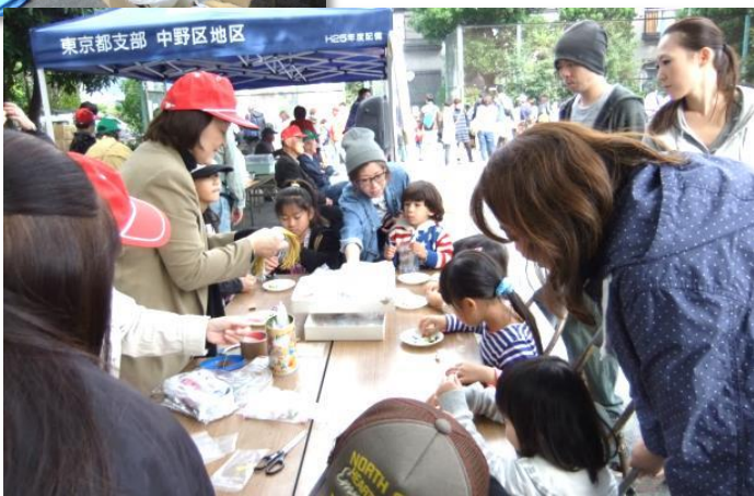
ビーズ工作 自分の好きな色のビーズを糸に通してステキなアクセサリを作っています。ちいさい子の集中力はすごいですよ。