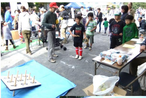
単純、簡単なルール の輪投げ。 でも難しい輪投げ。