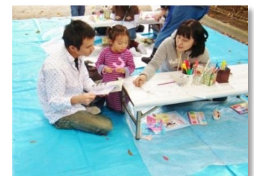
おとうさんと一緒にペーパーサートを作っているのかな・・・。