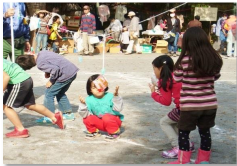
日差しがまぶしくてアンパンがよく見えません。