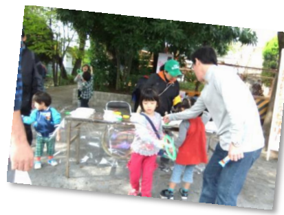
びっくりするほど大きなシャボン玉ができる。 大人にもやらせてくれるのかな？ いいなあ・・・。