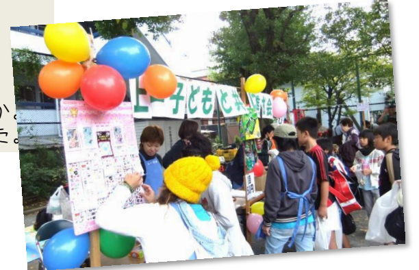
子どもと共に進む会の直営店です。