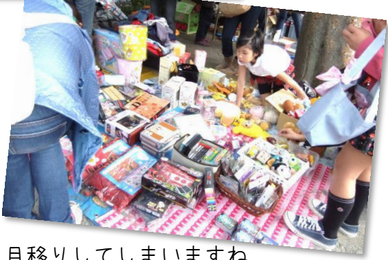
目移りしてしまいますね。