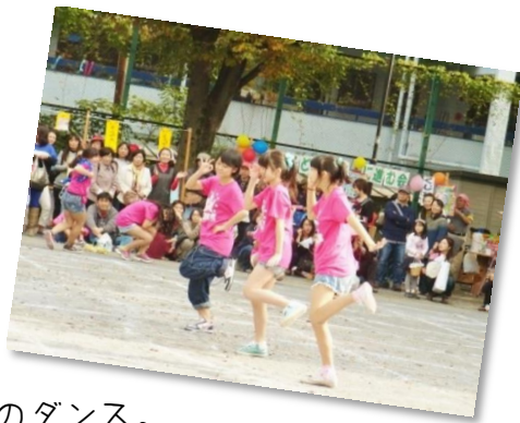
中学生のダンス。 “Dancing Star”の皆さん。 いろんな曲でリズムカルに元気に踊ってくれました。