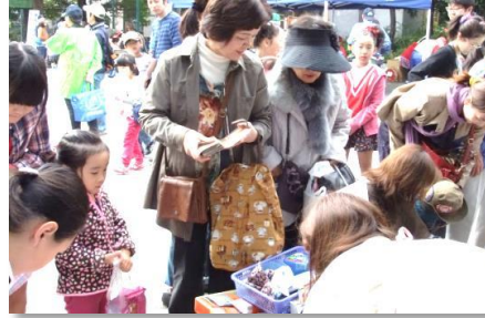
子どもまつりですけど、大人だって楽しんでいます。