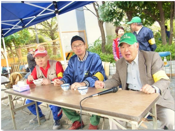
は～い裏方さん 左端、アンパンマンはパンくい競争の担当。 アンパンマンは本番に備えておでんを食べていました。