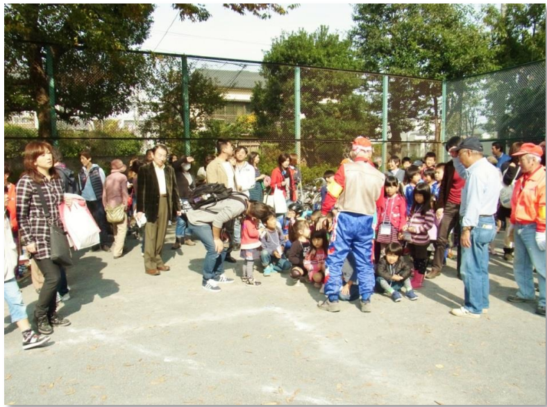
パンくい競争の選手？が集まっています。 出場資格は子どもだけですけれど、白桜小学校の校長先生も、参加したいなあ・・・そんな表情でしたよ。