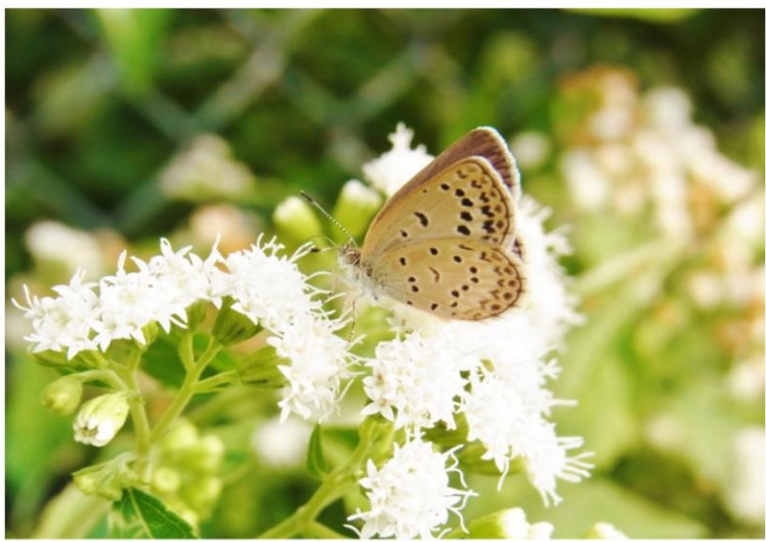
シジミチョウとヒヨドリバナ 秋の七草、フジバカマとおともだちのヒヨドリバナのようです。 二丁目公園のフェンス際に咲いていました。 上高田地域のあちこちに見ることができます。名前の由来は、ヒヨドリの声が聞こえる頃に咲き始めるからだそうです。