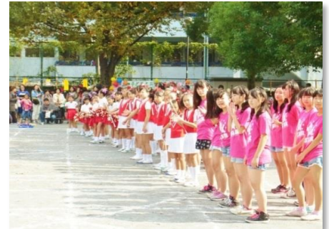
全員のダンスが終わりました。 みんなそろって先生に 「ありがとう！」