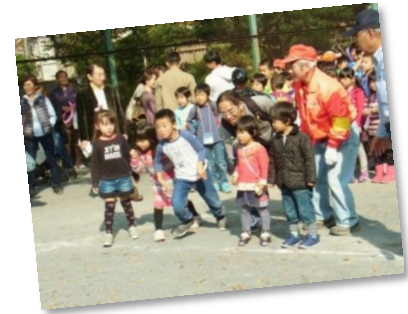
おっと・・・フライング！ 心はもうアンパンの方に飛んでいますね。