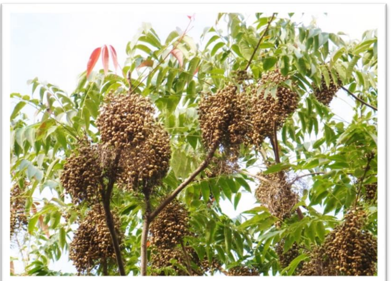
ハゼの実 10メートルは超えていそうな高さのハゼの木に、実がたくさん付いています。めずらしいですね。和ロウソクの原料になるそうです。