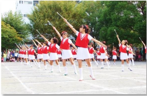
前列は上級生のようにです。 ここ一番のポーズ、決まりましたね！