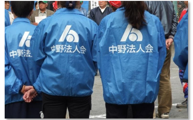
こちらのジャンパーは法人会の皆さん。 今日は税金に関するクイズのコーナーをオープンします。