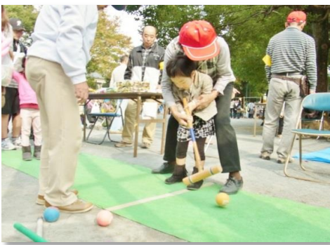
お孫さんほどのお客さん相手に、今日はゲートボールのレスプロです。腰は大丈夫でしたか・・・。