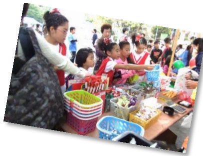
チアガールズ“キューティーフェアリーズ”の皆さん、出番の前にお買い物。