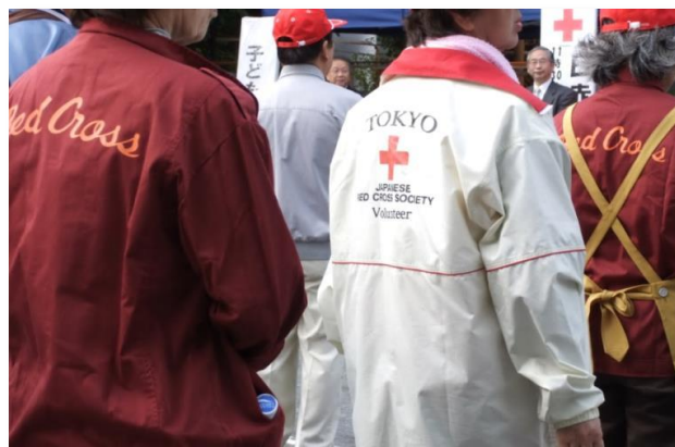
開会式の時に撮影。 日赤のジャンパー、新旧ありますね。 日赤の皆さんは、炊出し訓練でおにぎりをつくります。