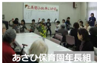
あさひ保育園年長組