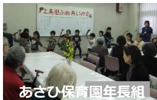
あさひ保育園年長組