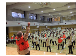
みんなで準備運動