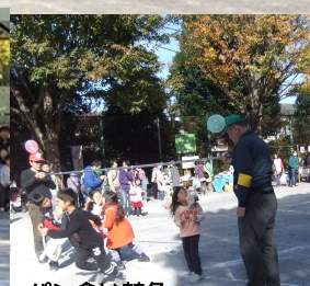
パン食い競争 どのパンにしようかなあ♡