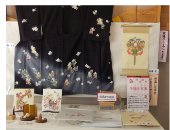
子ども大人も、レベルが高い作品展です