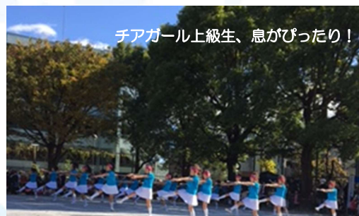
チアガール上級生、息がぴったり!