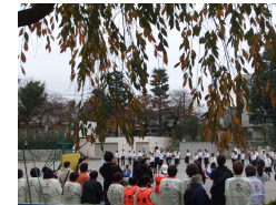
やっぱり鼓笛隊演奏は屋外が1番♡