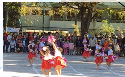
チアガール下級生のかわいい演技