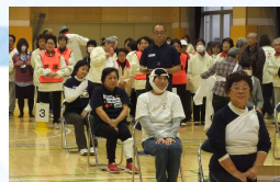
三角巾帯りりレー

お昼前後から雨ということで、体育館で実施することになった救護フェスタ。なんとか天気もってくれ、桃花小学校の鼓笛隊演奏だけは校庭で行うことができました。