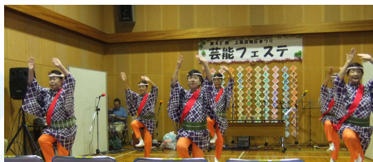
伝統芸あり、素晴らしい演奏ありの欲張りフェステです