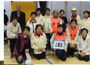
三角巾たたみ・本結びりりレー みごと三位入賞!